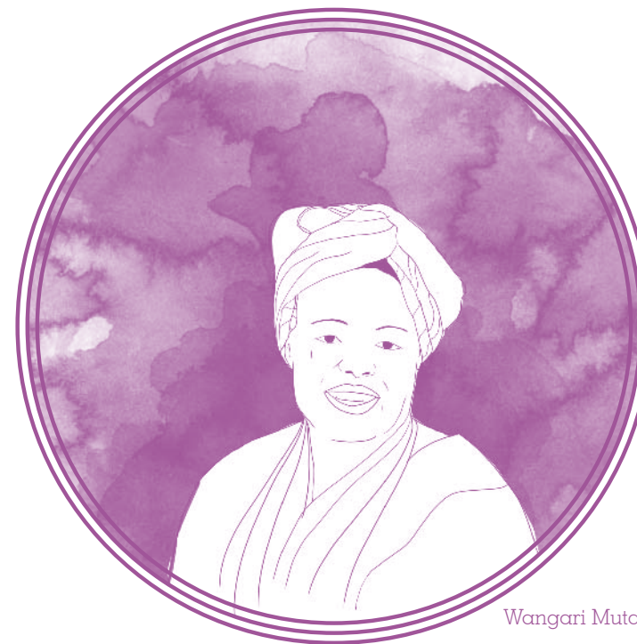
Wangari Muta Maathai

En la década de los 70 y 80, con la independencia de los estados africanos las mujeres estaban más involucradas con el nacionalismo que con el feminismo; sin embargo, a partir de los 80, las mujeres africanas entendieron que estaban pagando un precio muy alto por las inestabilidades políticas: el aumento de su tasa de pobreza, de malnutrición, de la mortalidad materna e infantil. Estos problemas han despertado una nueva conciencia feminista entre las mujeres africanas: toman cada vez más conciencia de su posición y condición como mujeres. En África Occidental y del Este, las mujeres deciden unirse para desarrollar una perspectiva feminista de género sobre determinados problemas.